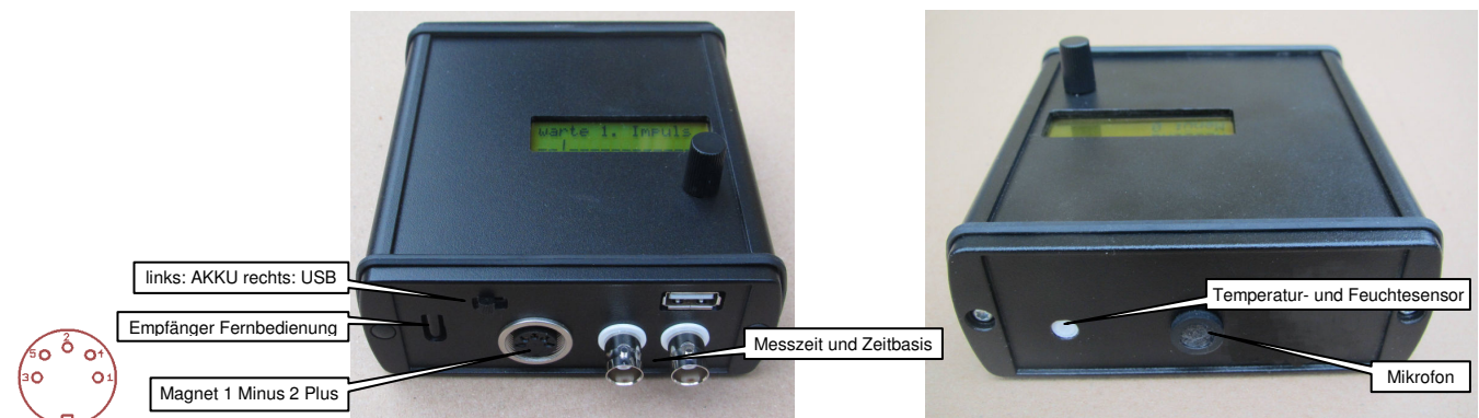
Abbildung 1: Ansichten des Messgerätes